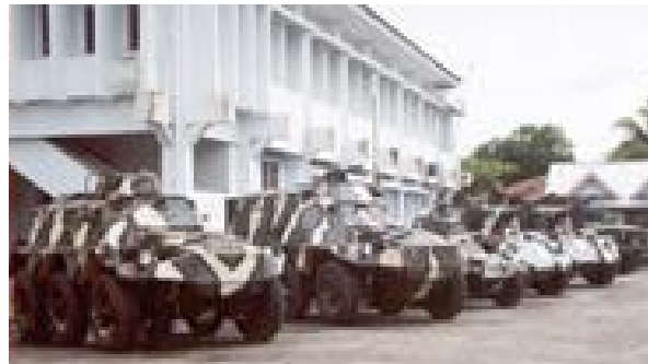
Pengerahan pasukan di Poso, tidak meredakan kekerasan

Pintu lain adalah perbatasan Malaysia dan Kalimantan. Dari Filipina bagian Selatan, para penyelundup menyelundupkan senjata-senjata itu dahulu ke Tawao (Malaysia). Dari sana, kemudian memasukkannya ke Nunukan (Kalimantan Timur), untuk selanjutnya dibawa ke Poso.