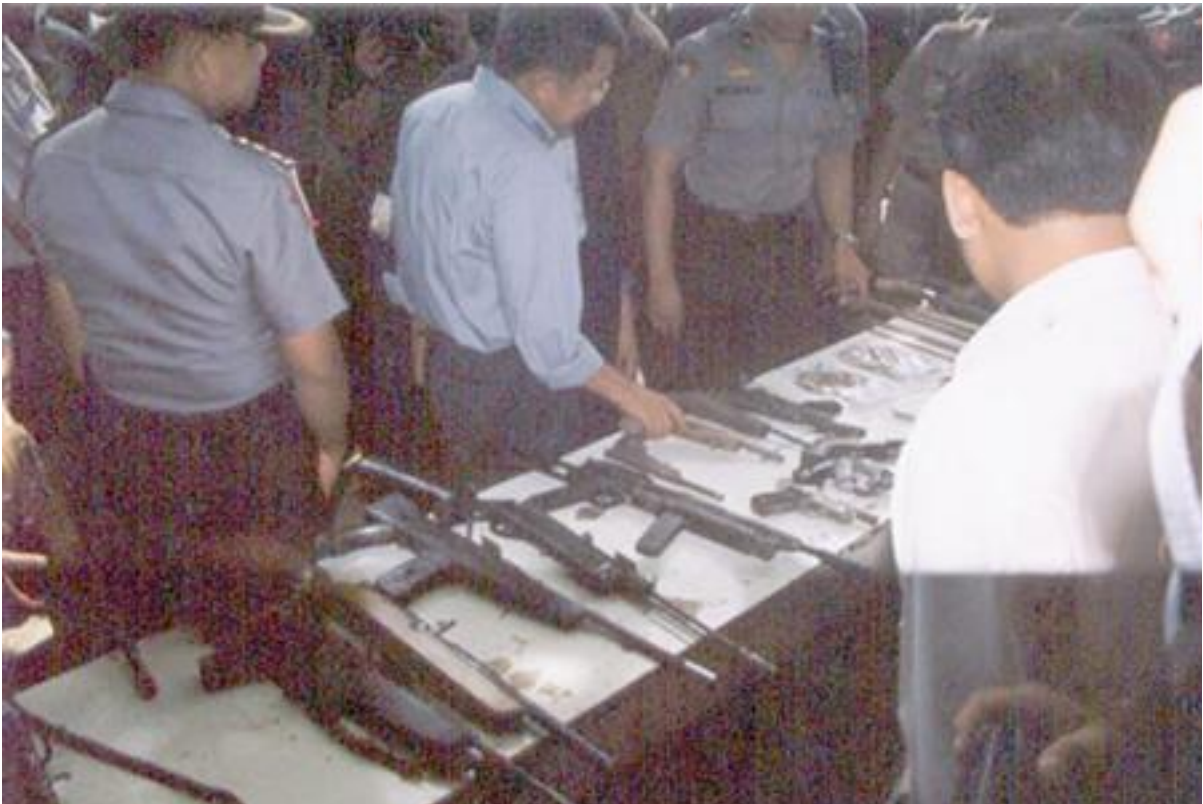
Menkokesra Jusuf Kalla sekarang Wakil Presiden RI melihat-lihat senjata rakitan yang dipergunakan saat konflik poso