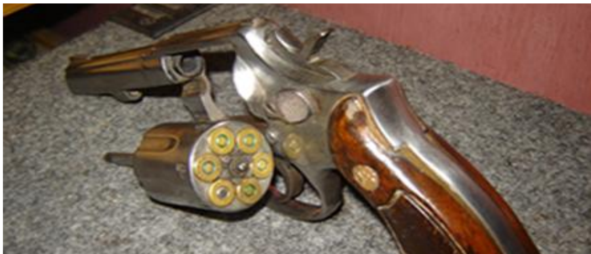
Salah satu jenis revolver S-W kaliber 38

Kasus lain terjadi di Desa Batugencu Kecamatan Lage. Ketika terjadi serangan di desa itu, 12 Agustus 2002, Sekretaris Crisis Center Gereja Kristen Sulawesi Tengah (GKST) menuding 17 anggota Brimob terlibat dalam serangan itu. Sehabis serangan itu, warga menemukan banyak selongsong