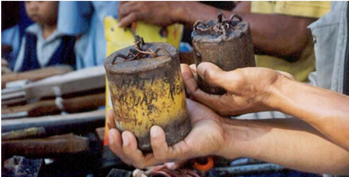
Bom rakitan yang dipakai warga dibuat dari bahan yang mudah diperoleh di daerah konflik.

pemusnahan 254 pucuk senjata rakitan laras panjang dan 71 senjata rakitan laras pendek, 7 Januari 2002. Pada bulan Maret 2002, aparat keamanan memusnahkan senjata laras panjang sebanyak 924 pucuk dan 347 pucuk laras pendek (Kepala Kepolisian Daerah Sulawesi Tengah 2004:2). Kemudian, hingga Juli 2002, warga menyerahkan 681 senjata api rakitan laras panjang dan 677 laras pendek ( Kompas , 29 Juli 2002). Sepanjang tahun 2004, terdapat 191 pucuk senjata laras panjang dan 22 pucuk senjata laras pendek berhasil dikumpulkan oleh aparat keamanan, berdasarkan hasil sweeping dan penyerahan yang dilakukan secara sukarela oleh masyarakat (Kepolisian Daerah Sulawesi Tengah 2005:5).